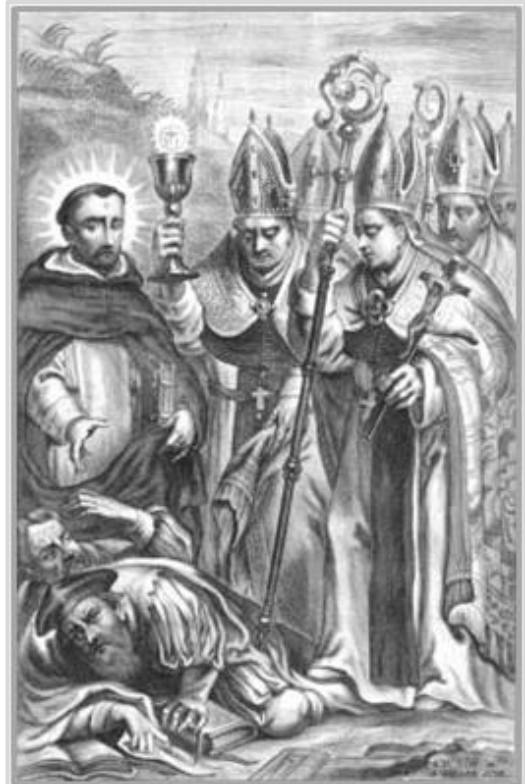
Arnaud a iní Cisterciánski opáti spolu so Svätým Dominikom (so svätožiarou) drvia bezbranných Katarov pod svojimi nohami. Obrázok predstavuje posvätenú verziu genocídy Katarov.

V úlohe opáta z Cîteaux, Arnaud bol hlavným opátom Cisterciánskeho mníšskeho rádu. Tak, ako Svätý Dominik, ktorý ho nasledoval, vzal si za úlohu konvertovať údajne heretických Katarov z Languedoku späť k pravej katolíckej cirkvi. Jeho kázania rovnako, ako kázania Svätého Dominika, vošli do dejín ako rozsiahle a ponižujúce fiasko, nevyhnutne hanba pre cirkevné knieža so zlatými ústami, ktorý tvrdil, že mu samotný Boh pomáha.