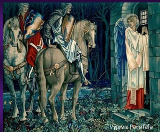
Výjev z Parsifala

Merovejskí králi mali od čias Chlodovika I zmluvu s Vatikánom. Zatiaľ čo sa sami zaviazali k vernosti matke cirkvi, cirkev im na oplátku sľúbila, že ich pápežská stolica bude podporovať v zjednotenej ríši Austrázie. Bolo im sľúbené, že navždy budú nositeľmi titulu „Nový Konštantín“, čo je titulom, z ktorého sa neskôr vyvinul titul „Svätý Rímsky Cisár“. Lenže „vernosť voči cirkvi“ sa zo strany Merovejcov po určitom čase začala