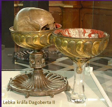
Lebka kráľa Dagoberta II

„Dôvod Dagobertovej kanonizácie ostáva nejasný. Podľa jedného zdroja ho kanonizovali vraj preto, lebo jeho relikvie údajne ochránili oblasť Stenay počas nájazdov Vikingov – pritom nevysvetlili, na akom základe mohli jeho relikvie preukázať podobnú moc. Cirkevní predstavitelia vykazujú zahanbujúcu hladinu nevedomosti ohľadom tejto záležitosti. Síce priznávajú tú skutočnosť, že z akéhosi dôvodu došlo k vzniku výrazného kultu Dagoberta... Ale nemajú žiadnu predstavu o tom, prečo by mal byť až natoľko uctievaný.“ Pritom je jasné, že cirkev sa dlho snažila vzdialiť od svojej úlohy v kráľovej smrti. [Napriek svojmu krátkemu životu a len trom rokmi na tróne,