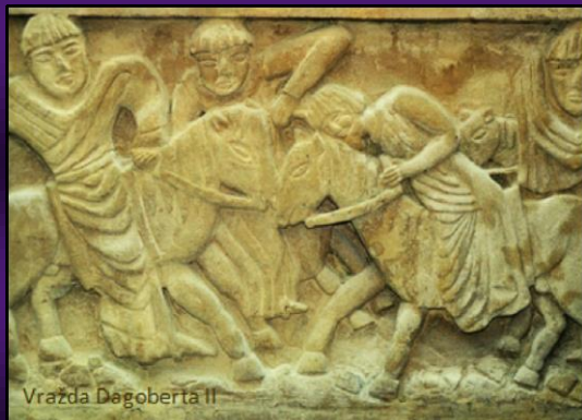
Vražda Dagoberta II

Navyše, ako priami potomkovia Ježiša Krista, mali takmer iste prístup k jeho tajnému učeniu, ktoré bolo nepochybne šokujúco odlišné od doktríny, ktorú propagovala cirkev, a oproti ktorej sa pravdepodobne viac podobalo „tajnej doktríne“ vzdorujúcich bohov. Akékoľvek verejné odhalenie takéhoto učenia pripísaného Ježišovi, alebo znalosť, že Merovejci by mohli byť jeho pokrvnými potomkami, by bolo malo katastrofálny dopad na cirkev. Ježiš Kristus by sa odhalil ako muž, ktorý mal predchodcov a potomkov, namiesto toho, že by bol synom Boha, ktorého porodila panna, ako o tom hlásala cirkev. Cítiac sa vážne ohrozenou samotnou existenciou Dagoberta, rímska cirkev vstúpila do sprisahania s majordómom paláca, Pipinom II, tiež zvaným Pipin tlstý.