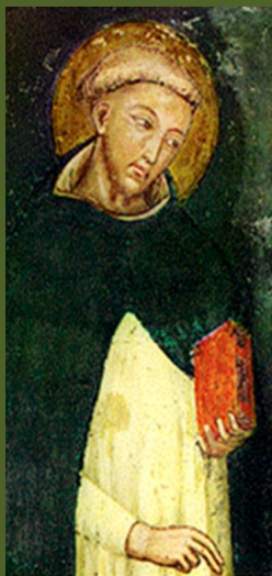
Svätý Dominik, zakladateľ Inkvizície