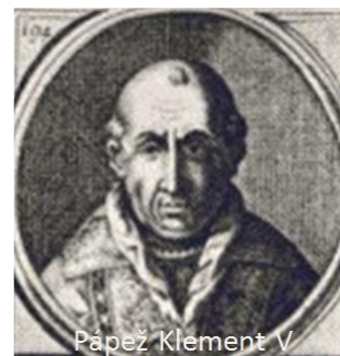
Pápež Klement V

Filip zariadil operáciu, akú by mu nacistickí esesáci a Gestapo boli závideli. Všetkým miestodržiteľom vo svojej krajine rozoslal zapečatené listiny, ktoré bolo treba otvoriť naraz, a ktoré obsahovali tajný rozkaz zatknúť všetkých Templárov vo Francúzsku a postúpiť ich kráľovým vojakom ako väzňov, zatiaľ čo sa im všetok majetok zhabe a ich preceptor sa stanú kráľovými zajatcami. Napriek príprave ohromného prekvapenia sa skoro ráno v piatok 13. októbra 1307